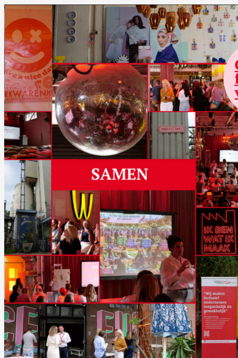
Gehele foto- verslag